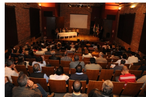
46ª Reunião Plenária Ordinária do CBH-MOGI - Centro Cultural "Leny de Oliveira Zurita" de Araras