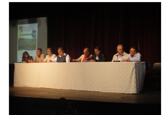
Integração de campanhas educacionais entre os membros dos CBHs PARDO e MOGI em Sertãozinho

Agradecem ainda o apoio dado pelas Prefeituras Municipais de São João da Boa Vista e Santo Antônio do Jardim; Associação de Proteção e Preservação Ambiental de Araras (APPA); Associação Educação do Homem de Amanhã de Araras (AHEDA); Serviço de Água, Esgoto e Meio Ambiente de Araras (SAEMA); Consórcio Intermunicipal de Preservação da Bacia Hidrográfica do Rio Jaguari Mirim (CIPREJIM); Sindicato da Indústria da Fabricação do Alcool no Estado de São Paulo (SIFAESP); e Diretorias Regionais de Ensino de São João da Boa Vista e Sertãozinho.