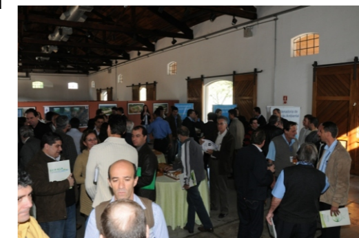
Confraternização durante a 46ª Reunião Plenária

Secretaria de Estado e Coordenadoria de Recursos Hídricos pretendem ajudar os comitês de bacia, vez que o comitê é um espaço maravilhoso para a integração dos três segmentos, seja no momento das inscrições e pré-reunião de confraternização da qual teve a oportunidade de presenciar e participar, como na reunião de trabalho propriamente dita, sob o imperativo do diálogo entre os diversos atores da bacia.