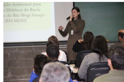
Palestra da Coordenadora da CTEA

O tema geral foi o Ano Internacional das Florestas, promovido pela ONU em 2011.