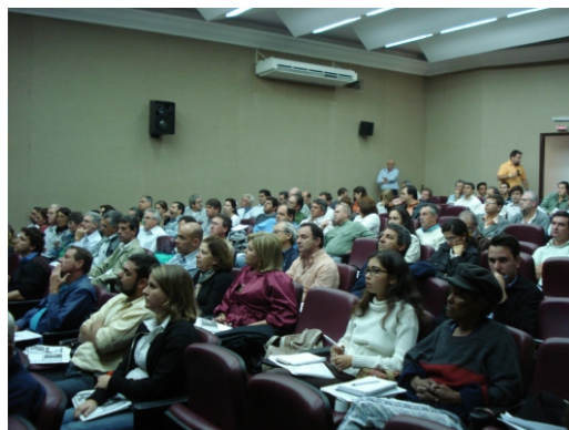
Criação da CT-COB na FZEA/USP em 2009

Sem dúvida nenhuma o aporte de verbas advindos da cobrança, acrescidas às do FEHIDRO nos permitirá, a partir de 2012, investimentos de maior monta, nas metas e ações prioritárias estabelecidas no Plano da Bacia e conquistarmos, em menor espaço de tempo, indicadores de melhoria de qualidade ambiental da bacia. Nestes 15 anos destaque-se a evolução que já experimentamos em termos de melhorias ambientais desde a instalação do CBH-MOGI, o que comprova que andamos no rumo certo e soubemos utilizar com sucesso os instrumentos de gestão em benefício da qualidade de vida da bacia. Estamos marcando época, executando melhorias, transferindo conhecimentos e garantindo um ambiente melhorado às gerações