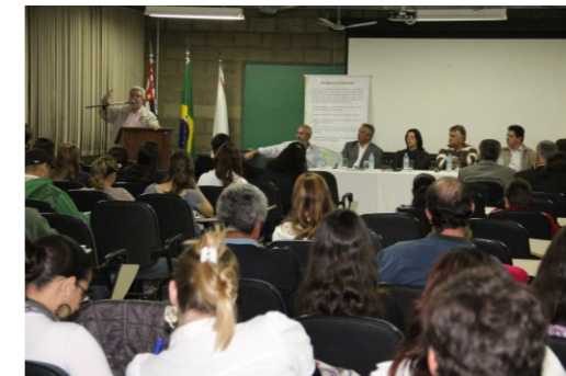
Mesa redonda em Araras