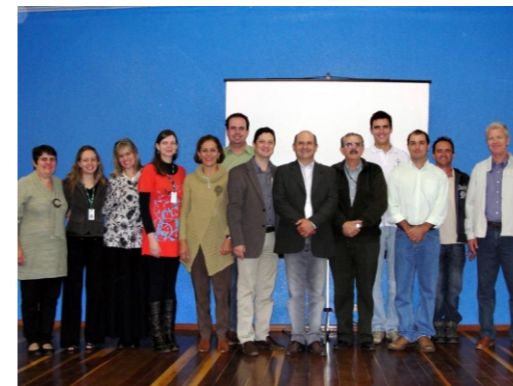
Mesa diretora e palestrantes em Aguaí