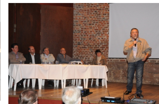
Diretor Presidente da CETESB Engenheiro Otávio Okano

SINGREH comemora 20 anos e que a Lei nº 7.663 de 30 de dezembro de 1991, é uma referência na abertura de possibilidades de participação e decisão em políticas públicas, nesse sentido noticiou que estão previstas inúmeras ações e relatórios destacando as conquistas construídas por todos nós que participamos do sistema além de propor novos avanços tais como a discussão do novo plano estadual de recursos hídricos.