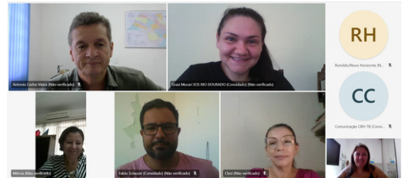
Legenda: Reunião da CT-TE em 20/03/2024.

Os resultados da análise e pré-qualificação, foram divulgados no dia 28 de março aos proponentes tomadores e de acordo com a Deliberação 006/2023, o 2º protocolo das solicitações pré-qualificadas, ocorreu de 08 a 12 de abril de 2024. O resultado dos projetos hierarquizados incidirá no dia 03 de maio, após reuniões das Câmaras Técnicas nos dias 22, 24 e 26 de abril de 2024.