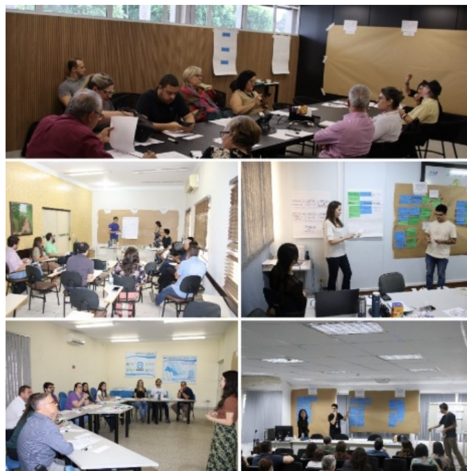
Figura 1 – Registro fotográfico das oficinas realizadas

O extenso material produzido durante essas oficinas foi tabulado em planilhas eletrônicas, analisado e consolidado. Os dados permitiram a formulação de 16 cursos que suprimiriam as lacunas de competência identificadas nas entregas pelos representantes do SIGRH.