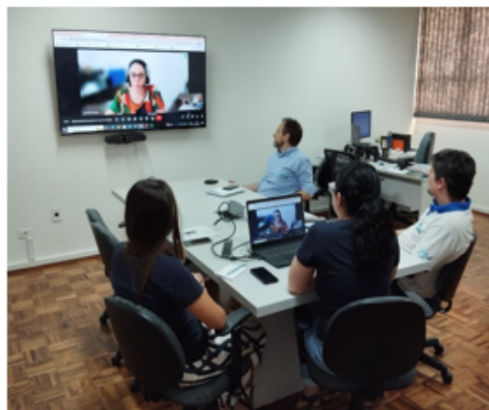
Figura 1 - Utilização do sistema de videoconferência e televisor adquiridos com recursos do PROCOMITÊS- CBH AT (esq.) e CBH PCJ (dir.)

Além disso, está em andamento o processo SEI 020.0004034/2023-01, para aquisição de mais 36 notebooks aos colegiados, com previsão para 2023.