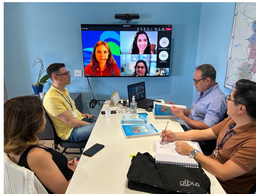
Fig. – Utilização equipamentos com recursos do Programa no CBH-AT