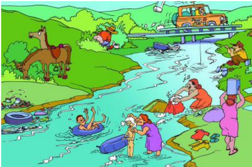
Uso e poluição da água

Um outro problema relacionado à agricultura e à pecuária é o desmatamento na beira dos rios. As matas ciliares (vegetação das margens dos rios) são importantes para evitar a erosão nas margens dos rios, impedindo que o solo seja carregado para dentro do leito do rio, causando assoreamento e prejudicando a qualidade da água. Em um rio assoreado a vida aquática fica prejudicada e a água transborda mais rapidamente causando enchentes. No Vale do Ribeira, apesar de ter ainda muita área coberta por Mata Atlântica, grande parte das matas ciliares foi derrubada ou está degradada.