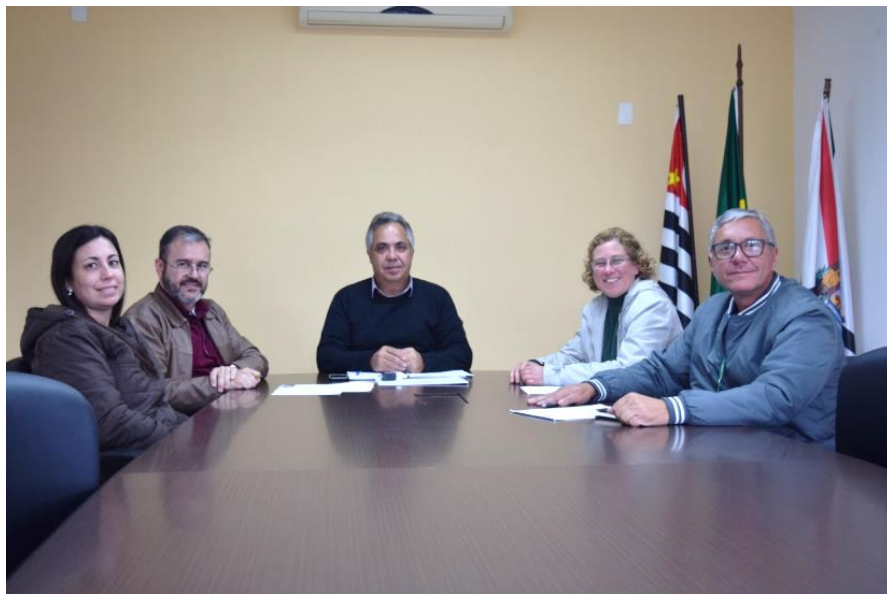
Prefeito Cláudio José de Góes - São Roque