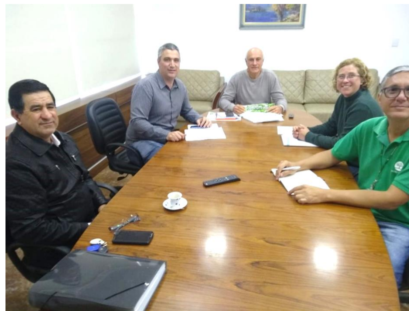
Prefeito José Tadeu de Resende - Piedade