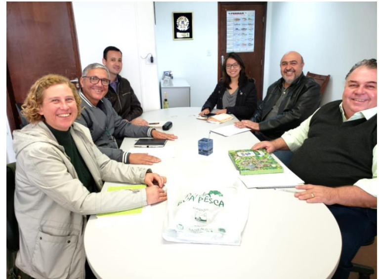
Prefeito Ovídio Alexandre Azzini - Mairinque