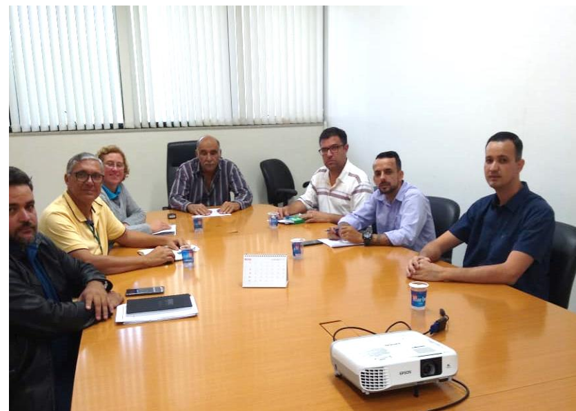
Prefeito Antônio Piassentini - Alumínio