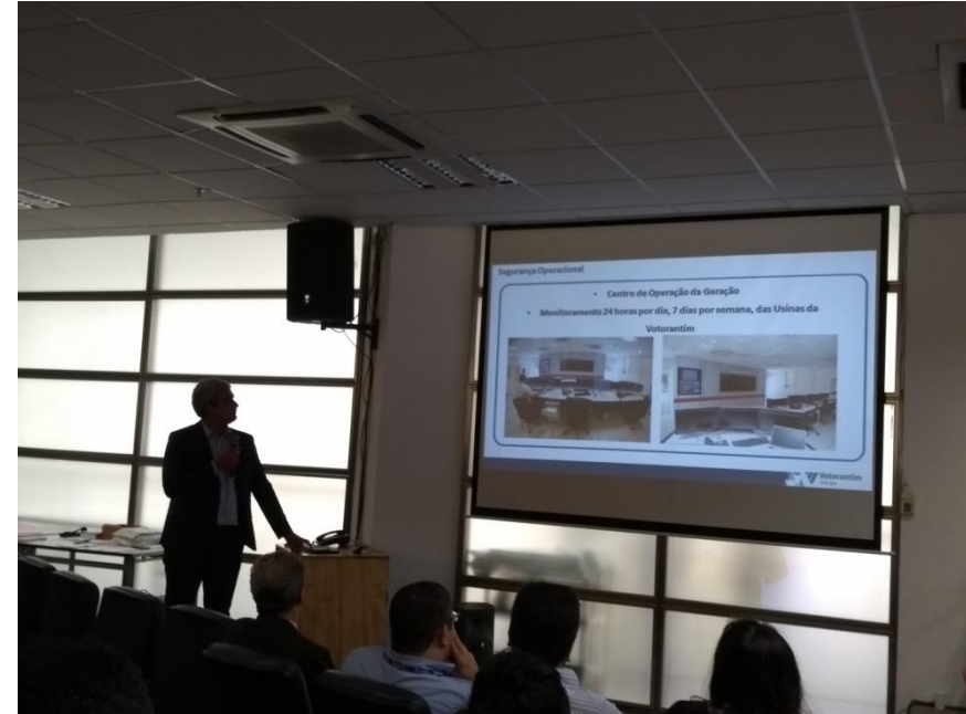
Apresentação da Votorantim Energia