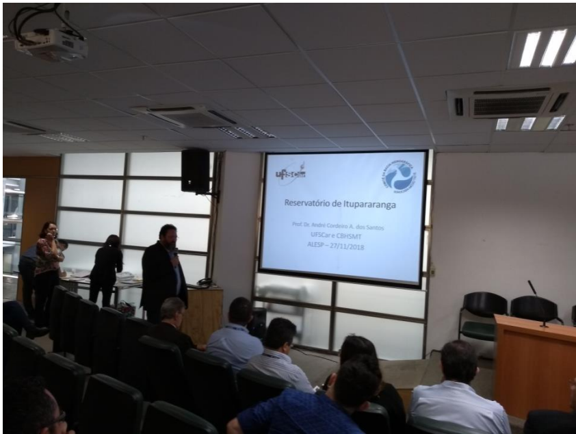
Apresentação do CBH-SMT