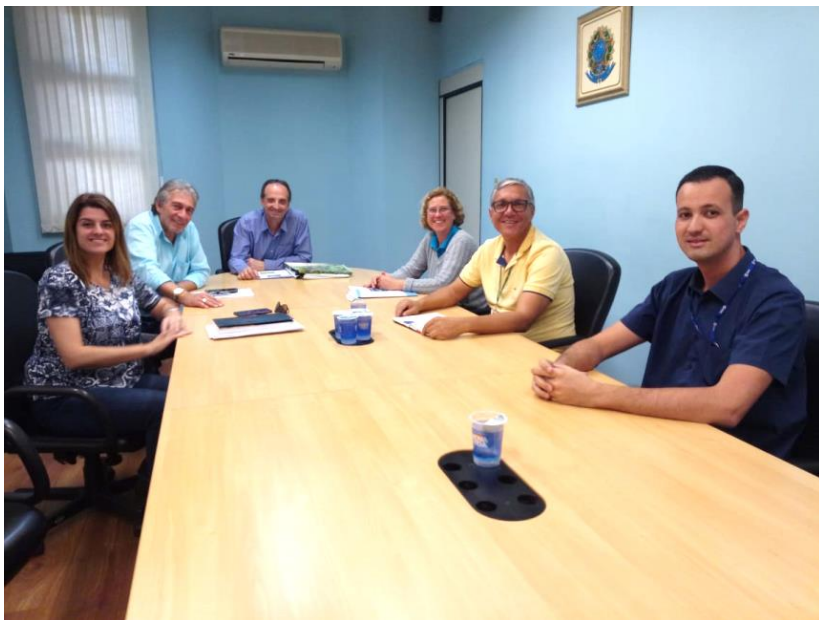
Prefeito Fernando de Oliveira Souza - Votorantim