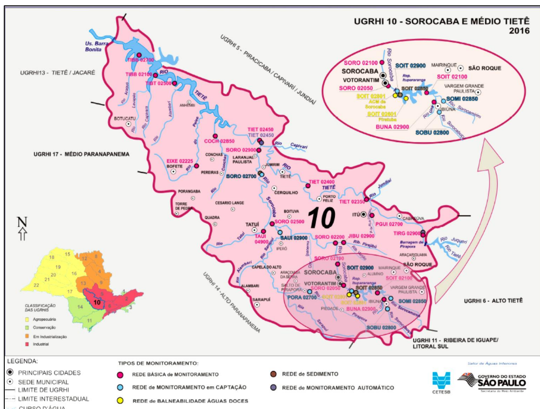
Figura 3.2-1 – Rede de Monitoramento da CETESB: UGRHI 10 (2016)

Na Figura 3.2-1 é possível visualizar a distribuição espacial dos pontos de amostragem da UGRHI 10, considerando a rede básica de monitoramento, rede de monitoramento em captação, rede de balneabilidade em água doce, rede de sedimento e rede de monitoramento automático.